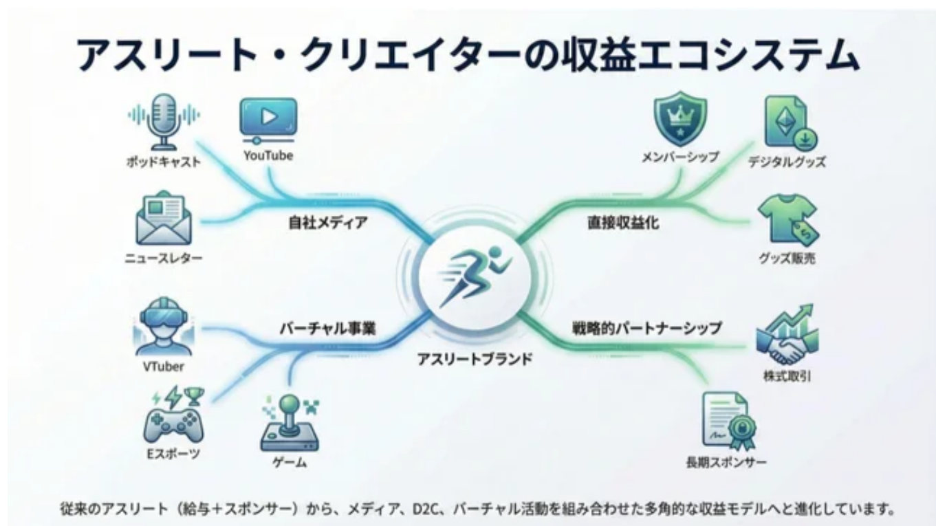
アスリートクリエイターの収益エコシステム

企業の課題を解決するBtoBソリューション提案や金融・契約リテラシーを学び、自らの活動資金を稼ぎ出す実務能力を養います。