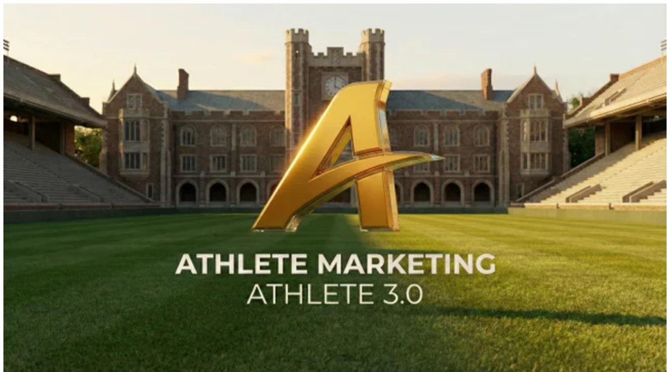
「アスリートマーケティング」ロゴ

学生課題の解決に挑む学生企業の株式会社ブルースプリング（本社：岡山県）は、トップアスリートマネジメントのノウハウを持つ株式会社川本企画（本社：神奈川県）と共同で、深刻化するスポーツ界の構造的バグ（不祥事や将来不安）に対するソリューションとして開発された次世代アスリート教育インフラ『ATHLETE MARKETING（アスリートマーケティング）』をローンチし、組織強化・教育OSとしての連携提供を開始いたします。