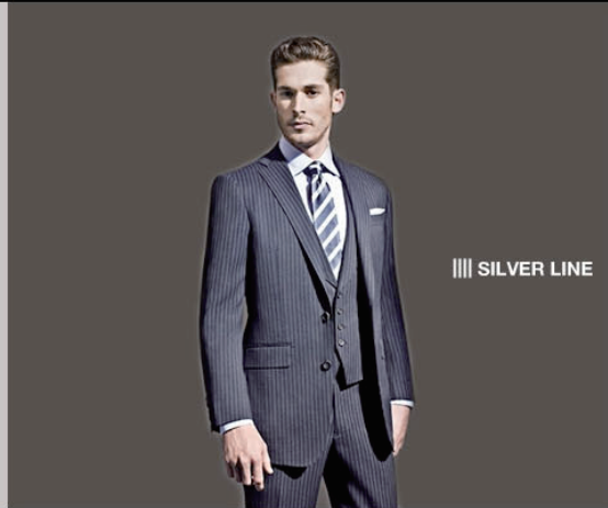
|||| SILVER LINE