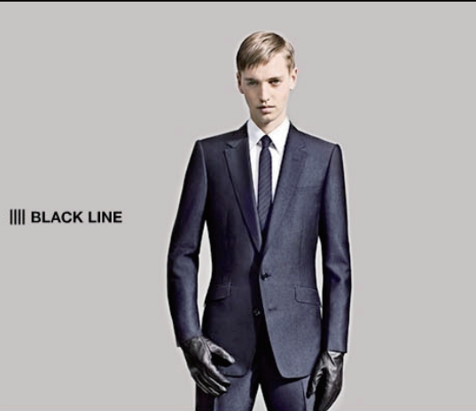
|||| BLACK LINE