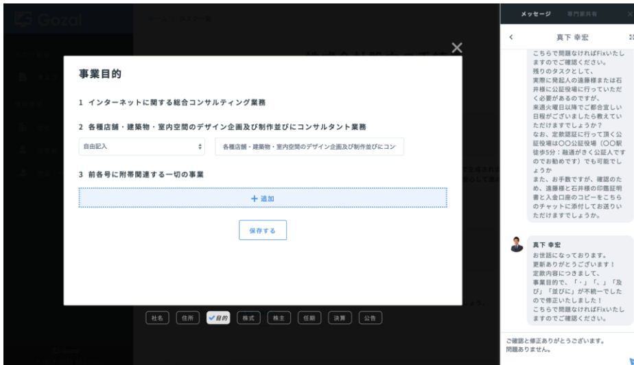
「Gozal会社設立」ツール イメージ図

単なる電子定款認証手続きの代行ではなく、起業後の展開も見据えたアドバイスを専門家から受け取ることで、会社設立支援サービスとしての品質を高めていることが特徴です。日本の起業家を効果的にサポートしたいという思いから、「自動化」と「人力」を融合した本サービスを開発するに至りました。