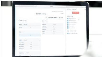
給与計算の自動化