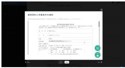
雇用契約を自動で生成