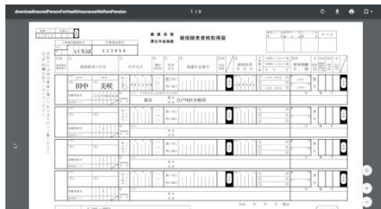
役所への届出書類も自動生成