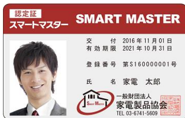
認定証 (イメージサンプル)

なお、お店・オフィス側でも、「登録証(※1 ステッカー)」や「のぼり(※2)」を掲げるなど、分かりやすい工夫をしてお客様をお迎えいたします。