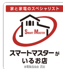
※1 登録証(ステッカー)