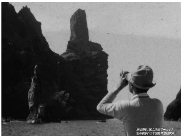
おしま 男島(西島)の鳥を観察