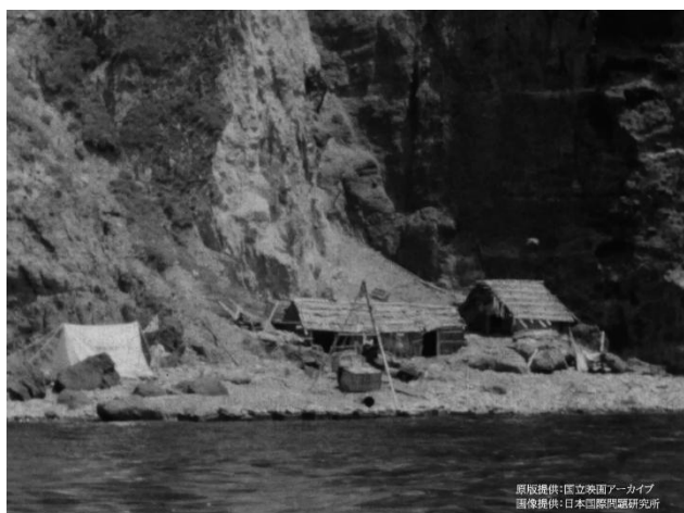
石原海岸に建つ猟師番屋