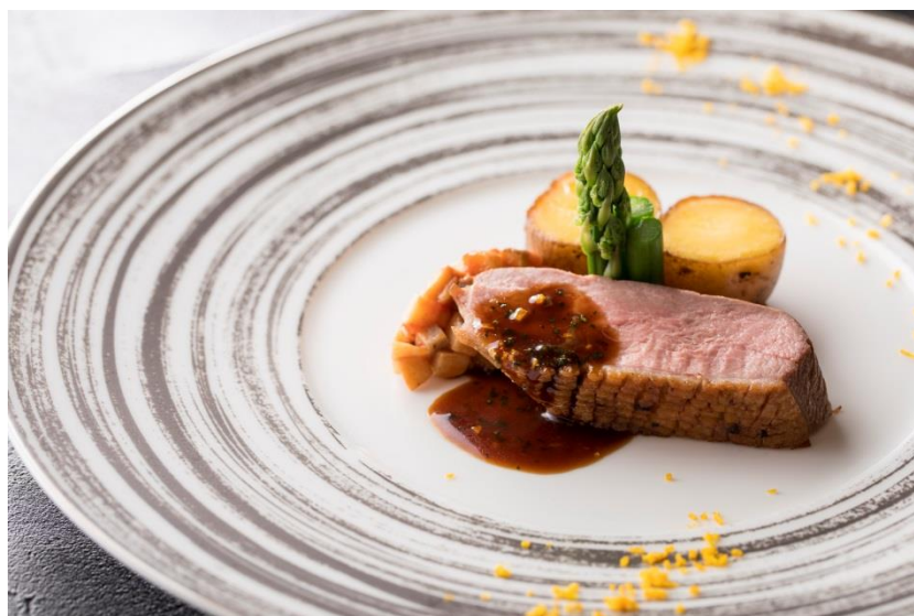
「鴨胸肉のロースト オレンジバルサミソースジャガイモのコンフィと茸のラタトゥイユ」