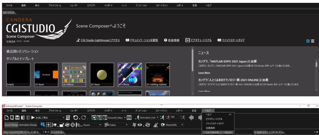
「Scene Composer」のウェルカムページ(上)とツールバー(下)の日本語インターフェイス

日本のユーザーにもよりご利用いただけるように、「Scene Composer」に日本語インターフェイスが追加されました。