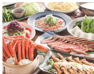
北海道オールスターズコース