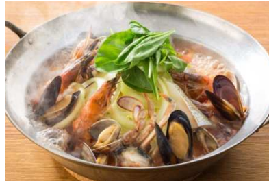
ちょっと贅沢したい派に！ 【ブイヤベース鍋】 お一人様+400円