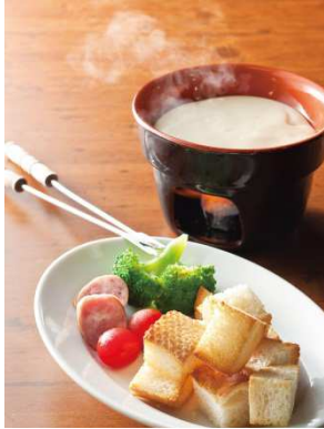
ワインを楽しみたい方に！ 【自家製チーズフォンデュ】 お一人様+400円