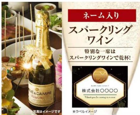
ネーム入り【スパークリングワイン】 フルボトル：3,150円 ハーフボトル：2,625円