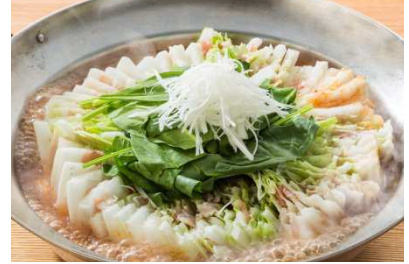
しっかり食べたい派に！ 【ミルフィーユ鍋】 お一人様+400円