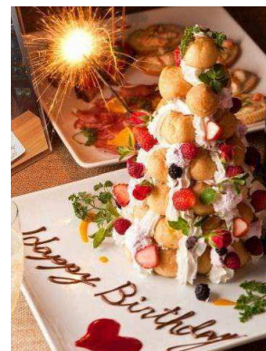
バースディプレート付【プロフィットロール】 スペシャルプライス！1,050円