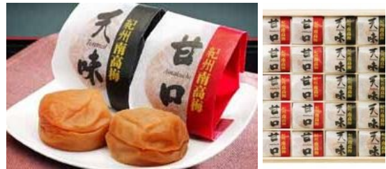
【紀州南高梅 二梅(にばい) 20粒】 一箱 5,000円 (税・送料込) 甘口はちみつ10粒、つす塩味天味10粒