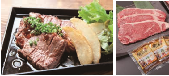
【USアンガスビーフサーロインステーキ】 一箱 5,000円 (税・送料込) 約180g×3枚+宮のたれ小袋×3袋