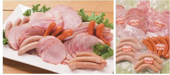
【相模豚ハム・ウィンナーセット】 一箱 5,000円 (税・送料込) ベーコンスライス250g、ロースハム・モモハム各100g、 チョリソー5本、しそ入りウィンナー5本、ガーリックウィンナー3本