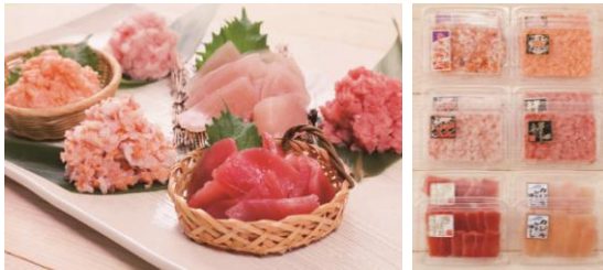
【工場直送 海鮮詰め合わせ6種セット】 一箱 5,000円 (税・送料込) ネギトロ、サーモンネギトロ、キハダ切身し中落ち風 海鮮宝石箱、ピンチョウマグロたたき、マカジキ切り落とし