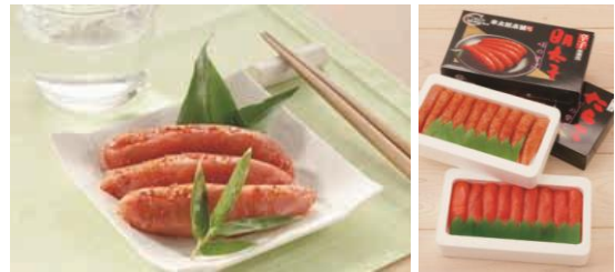
【博多明太子&たらこセット900g】 一セット 5,000円 (税・送料込) 辛子明太子400g、たらこ(切り)500g