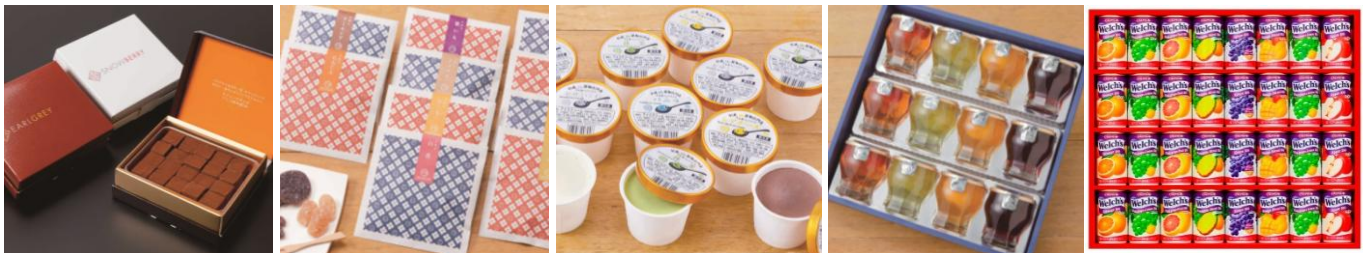
【シルスマリア生チョコレート詰合せ】 一セット 4,500円 (税・送料込) 公園通りの石畳20粒、スノーベリー20粒、アールグレイ20粒 各1箱