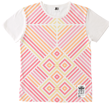
01 COLOSSUS TITAN