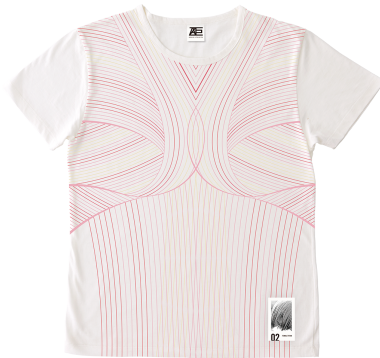
02 FEMALE TITAN