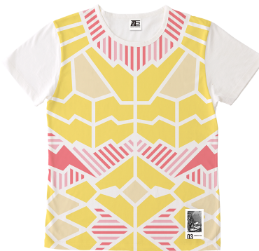
03 ARMORED TITAN