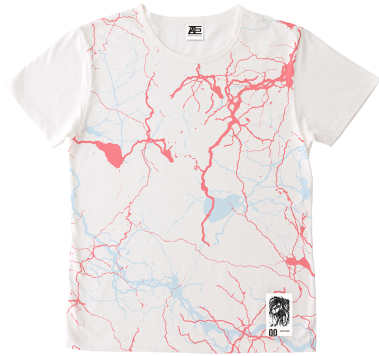
00 EREN YEAGER