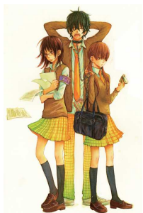
『となりの怪物くん』