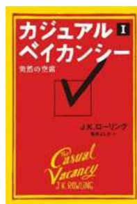
『カジュアル・ベイカンシー 突然の空席』