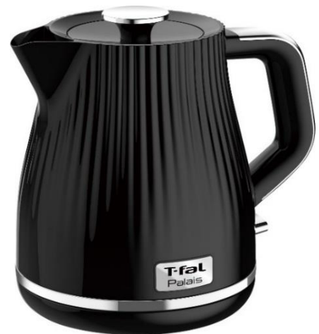
パレ ブラック 1.0L

※1 2011年9月～2019年3月自社アンケート調査より(n=117,736)。