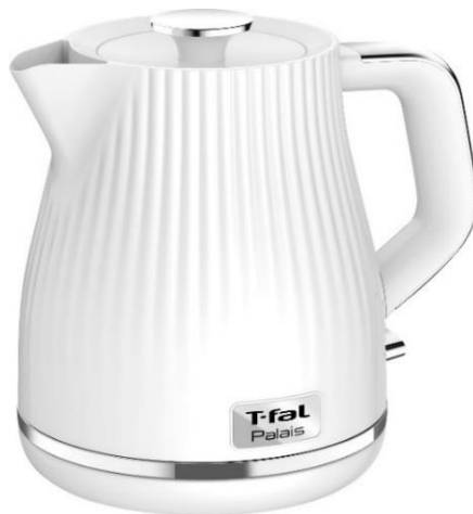
パレ ホワイト 1.0L