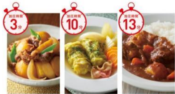
左から)肉じゃが、ロールキャベツ、ビーフカレー