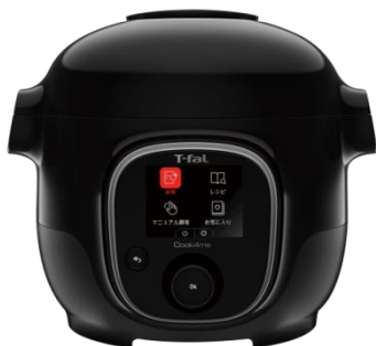
クックフォーミー ブラック 3L