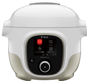
クックフォーミー ホワイト 3L