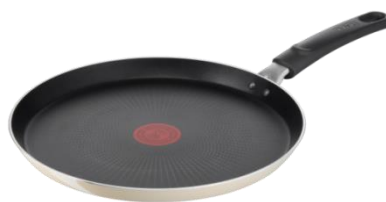
パリ・カフェ フレンチパン 27cm