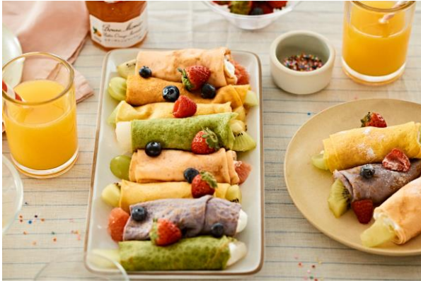
レインボークレープ