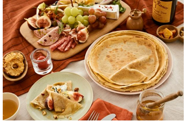
パーティボードクレープ