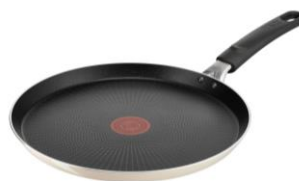
ボナペティ フレンチパン 27cm