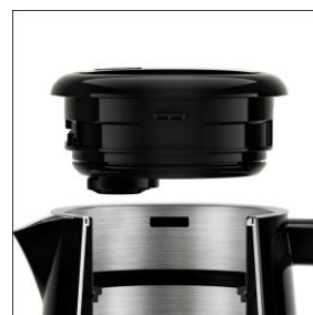
【倒れてもお湯がこぼれにくい、フタの設計】