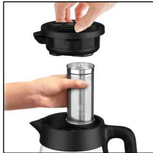
取り外せる茶こし

取り外しができる茶こしが付いているので、お湯を沸かした後、ティーポットのように緑茶や紅茶をそのまま淹れることができます。さらに、1～20分まで1分単位での煮出し時間を設定できる“煮出しボタン”を使って、麦茶や豆茶などを手軽に作ることができます。本体は、耐熱強化ガラス製(耐熱温度 170℃)。