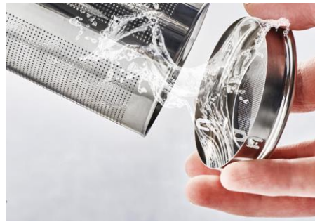
茶こしの底も外せるのでお手入れ簡単