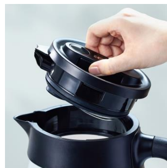
【倒れてもお湯がこぼれにくい、フタの設計】 【転倒お湯漏れロック機能付き】