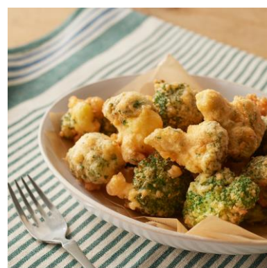
■ブロッコリーチーズフリット