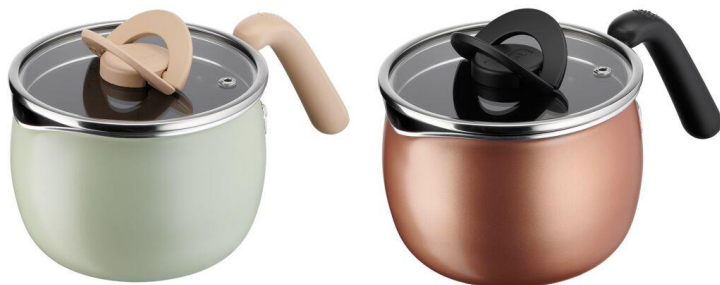
オプティスペース マルチポット ライトミント 14cm