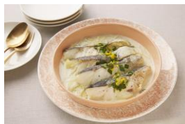
(無水) 白身魚のクリーム煮