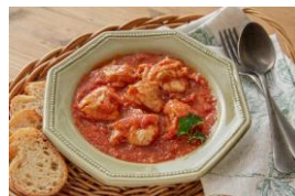
(無水) トマトデミチキン