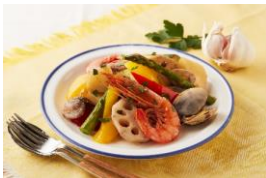
(無水) 魚介のガーリック風

● 食材に含まれる水分と最低限の調味料で素材の旨みを引き出す無水調理。素材本来のうまみと栄養を逃さずいただくことができます。