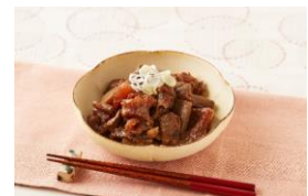
(無水) 牛すじこんにゃく煮