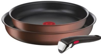
インジニオ・ネオ IHモカ セット3