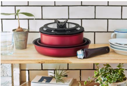
重ねてコンパクトに収納

取っ手がとれるので、重ねてコンパクトに収納できるほか、オープン調理ができたり、そのまま食卓に出したり、後片付けもお皿のように丸洗いができるので、お手入れも簡単です。