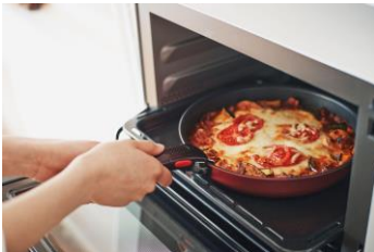
そのままオープンへ