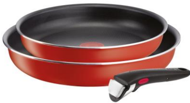
インジニオ・ネオ パブリカレッド セット3