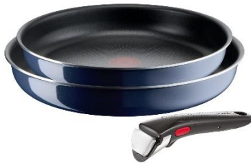
インジニオ・ネオ ロイヤルブルー・インテンス セット3