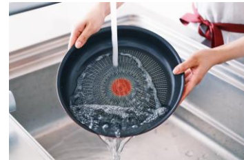
お皿のように丸洗い