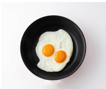
フライパン 22 cm