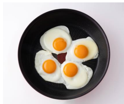
フライパン 26 cm