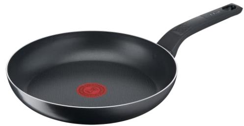
《プレゼント商品》 マスタードブラック フライパン 25cm (ガス火対応製品)