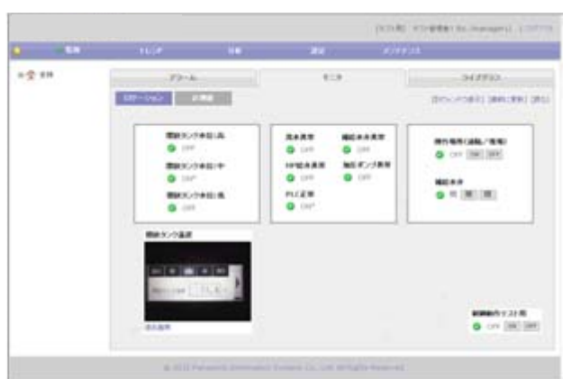
監視画面のイメージ(異常監視)