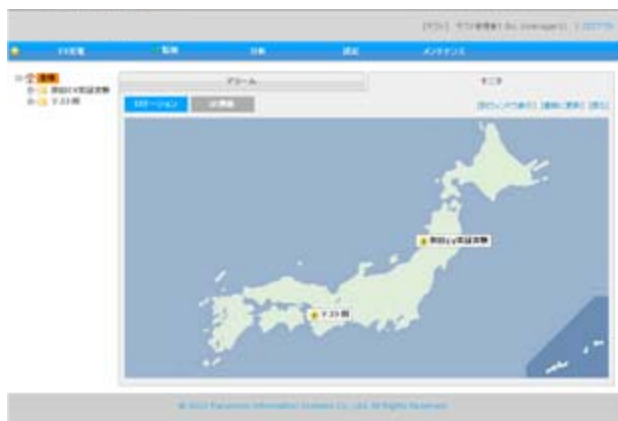
監視画面のイメージ(複数拠点同時管理)

※2:本件のコンサルティングはパナソニック ホームエンジニアリング株式会社が担当