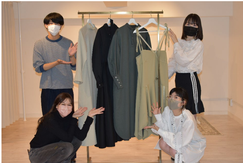
「teshioni maison407」第1期生と販売開始する商品