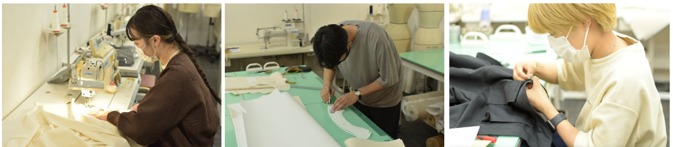
サンプル作成の様子