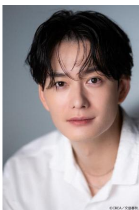
岡田 将生（おかだ まさき）

1989 年 8 月 15 日生まれ。東京都出身。2006 年デビュー。近年の出演作に、映画『ラストマイル』（2024）、『ゆきてかへらぬ』（2025）、『アフター・ザ・クエイク』（2025）、ドラマでは、NHK 2024 年度前期連続テレビ小説『虎に翼』『ザ・トラベルナース』、『御上先生』『ちょっとだけエスパー』などがある。細田守監督最新作『果てしなきスカーレット』が公開中。初出演となる韓国製作ドラマ Disney+オリジナル韓国ドラマ「殺し屋たちの店」シーズン2の配信を控える。