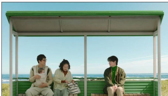
新 TVCM「3 色の鳥・ゆうちょバス お子様口座」篇より

本 CM は、昨年度に放映した「ゆうちょバス」シリーズの第二弾で、ゆうちょ銀行が“年金受取口座”や“お子様名義の口座”として、多くのお客さまから選ばれている様子を描いています。日本郵政グループ各社の広告に登場している 3 色の鳥・チッチとともに、「ゆうちょに詳しい謎の男性」として、岡田 将生さんがゆうちょ銀行の魅力を存分にお伝えいたします。