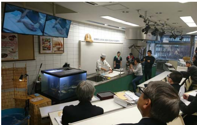
活魚需要向上を図る為のセミナーの様子