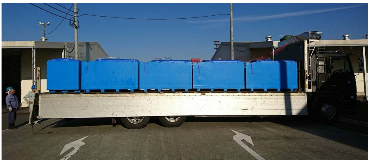
魚活ボックスによる輸送の様子（大型車で、大量に輸送することも可能）

ハモに睡眠実施している様子の動画: https://youtu.be/esur1ud8kq8