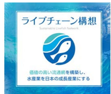
魚活ボックスを活用した活魚流通網、ライブチェーンの概要