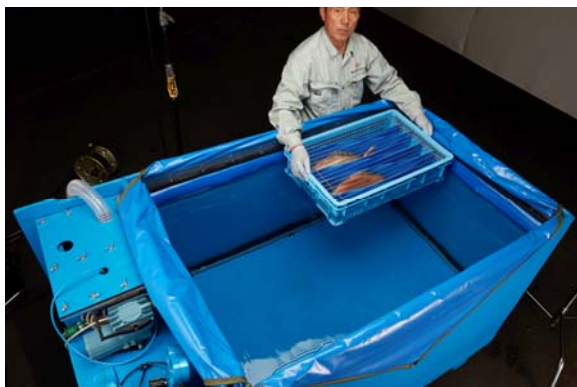
マダイに睡眠を実施している様子

※魚活ボックスは、二酸化炭素により魚を睡眠状態で輸送する装置のことを言います。魚を眠らせることで水質悪化を抑制できる等、魚への負担軽減による高品質を維持できるほか、回遊スペースの省力化による輸送コストの削減が実現いたします。（魚介類の麻酔維持システム、麻酔維持方法および運搬方法、特許番号 6236575、(2017年11月2日)）