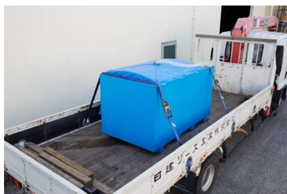
魚活ボックスによる輸送の様子（小ロットでも輸送が可能）

魚活ボックス製品 URL: https://youtu.be/_RCfu6FLn5M