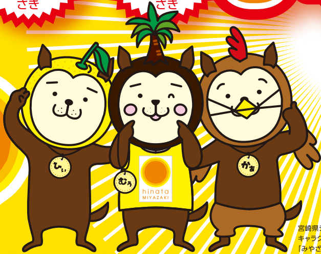
宮崎県シンボル キャラクター 「みやざき犬」