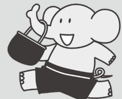
川崎市 ばいそーくん