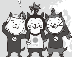
宮崎県 みやざき犬