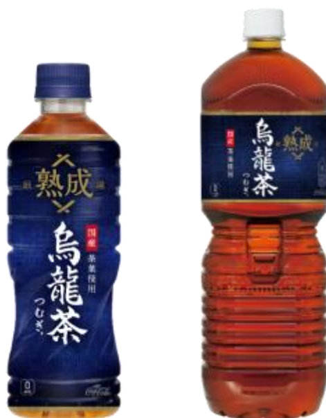
525ml PET／2L PET

URL : https://secure-c.cocacola.co.jp/nihon-tsumugi/