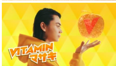
Title: VITAMIN マサキ VO: つまりビタミンマサキと