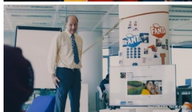
テッド: おいしすぎる～