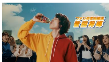
Title: ファンタ宣伝部長 菅田将暉 女性たち: キャー! ダブルマサキよ