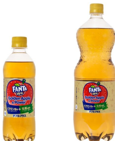
「ファンタ ゴールデンアップル & パワー」 490mlPET/メーカー希望小売価格 140円(消費税別) 1.5LPET/メーカー希望小売価格 320円(消費税別)