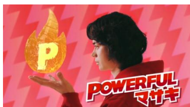
Title: POWERFUL マサキ VO: パワフルマサキが…