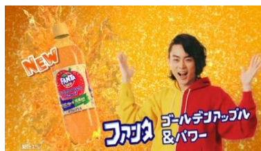
Title: ファンタ ゴールデンアップル &パワー 菅田さん: ファンタ ゴールデンアップル &パワー