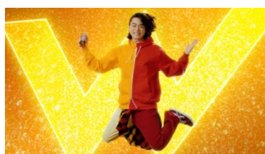
菅田さん: おいしー!!