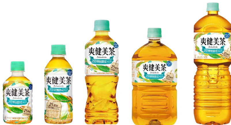
「爽健美茶」25周年特別限定ブレンド 280ml / 300ml / 525ml / 1L / 2L PET