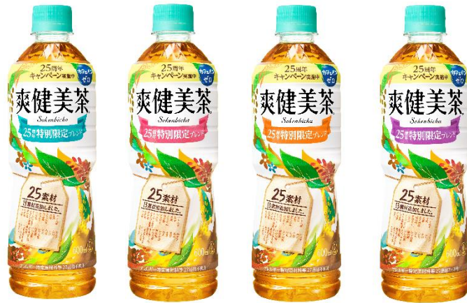
「爽健美茶」25周年特別限定ブレンド 600ml（青・ピンク・オレンジ・紫）