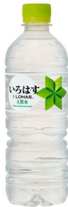
「い・ろ・は・す 天然水」 555ml PET

コカ・コーラシステムは、厳選された日本の天然水を使用したミネラルウォーターブランド「い・ろ・は・す 天然水」を、環境負荷を低減した新パッケージに刷新し、2017年5月22日（月）より全国で発売します。また昨年に引き続き、「い・ろ・は・す」の売上の一部を、公益財団法人コカ・コーラ教育・環境財団を通じて、日本の各地で水資源の保護を行っている自治体・非営利活動法人（NPO）に寄付し、その活動を支援する「い・ろ・は・す 水源保全プロジェクト」を展開します。