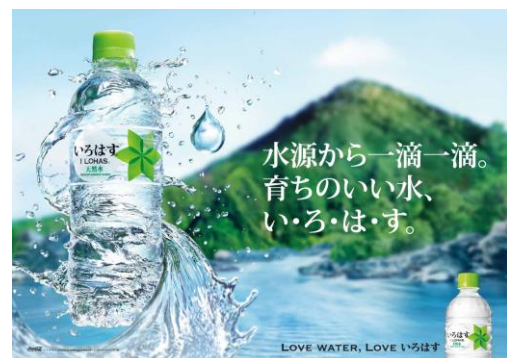
「いろはす 天然水」キービジュアル

左から 2L PET、1020ml PET、555ml PET、 340ml PET、285mlPET