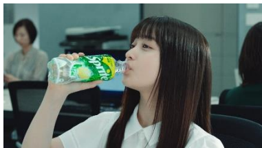
橋本さん： 「Sprite」、 飲まないと！