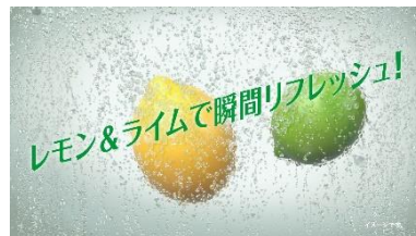
ナレーション： レモンとライムで 瞬間リフレッシュ！