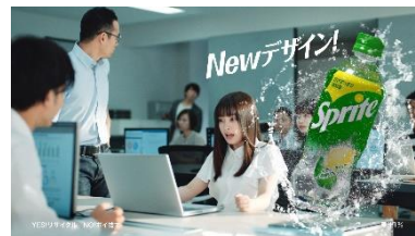
Title： NEW デザイン！ ナレーション： 「Sprite」