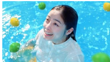
橋本さん： すっきりした！！