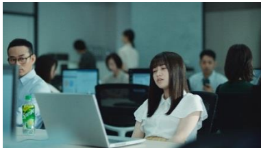
橋本さん： あーもう！