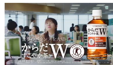
12.からだすこやか茶W～♪