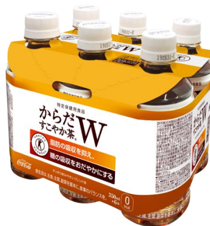
350ml PET 6 本パック