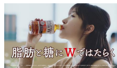
10.脂肪と糖に W ではたらく