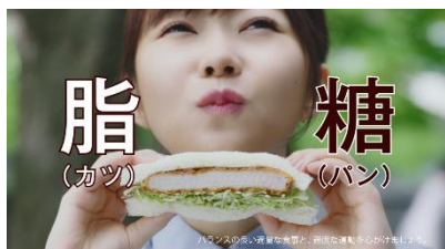
2.だから、カツにもパンにも