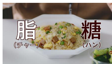
8.チャーにもハンにも