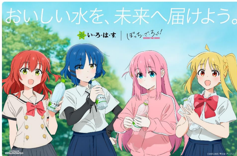
その1本の天然水が、日本の美しい水源の森を守ります。あなたが購入した「い・ろ・は・す」の売上の一部が日本の水源を守る活動に寄付されます。

コカ・コーラシステムは、厳選された日本の天然水を使用したナチュラルミネラルウォーターブランド「い・ろ・は・す」において、大人気アニメ「ぼっち・ざ・ろっく！」とのコラボレーション企画を展開します。