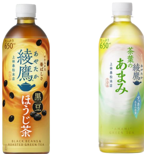
【左】「綾鷹 黒豆ほうじ茶」650mlPET メーカー希望小売価格/税別 180 円

「綾鷹 茶葉のあまみ」は、茶葉と抽出方法を見直しリニューアルしました。上林春松本店協力のもと、厳選した国産茶葉を 100%使用。すっきりとした味わいが特徴の厳選茶葉を、低温でじっくり抽出することで苦み・渋みを抑え、うまみ・あまみを引き立て、よりすっきりごくごく飲みやすい風味になりました。茶葉のあまみ独自の「あまみ茶葉(かぶせ茶)」を 12%使用しています。