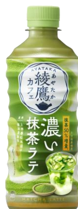
「綾鷹カフェ 濃い抹茶ラテ」440mlPET メーカー希望小売価格/税別 166 円

3月31日(月)より、厳選した上質な素材とこだわりの製法で、まるで本格カフェのような味わいが楽しめる「綾鷹カフェ」シリーズにおいて、「綾鷹カフェ 濃い抹茶ラテ」を全国で発売します。従来の「綾鷹カフェ 抹茶ラテ」より 50%抹茶量を増量し、綾鷹史上最も濃い抹茶量に仕上がりました。こだわりの国産抹茶 100%はそのままに、宇治抹茶を使用することで抹茶のうまみと奥深い味わいを実現しています。