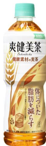
「爽健美茶 健康素材の麦茶」 600ml

新しいパッケージデザインは、「爽健美茶」の爽やかな白を基調に、体についた脂肪を減らす成分の含まれる特別な機能性表示食品の麦茶であることをあらわす金色の麦の穂を力強く表現したデザインになっています。