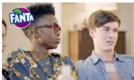
アレックス 本当にファンタってハジけてる。 マジ超おいしいから、ぶっちゃけ オレたちでも売れるよ。

家のリビングで談笑している海外の若者たちのグループ。そのうちのひとり、アレックスが「『ファンタ』ってマジ超おいしい。ぶっちゃけオレたちでも売れるよ」と自信満々に「ファンタ」を飲みながら自撮りした写真を SNS に投稿し、瞬間にそれが世界中で話題に。写真の拡散がきっかけでアレックスは「ファンタ」のグローバル宣伝部長になります。その後、グローバル宣伝部長のアレックスから「日本は任せたよ！マサキ！」とスマートフォン越しに呼びかけられたのは菅田将暉さん。「OK！任せといて！」と、日本の「ファンタ宣伝部長」就任を快諾すると、「ファンタ」のフルーティーではじける炭酸に気持ちもハジける菅田さん。今後始まる『#ファンタおいしいチャレンジ』の宣伝活動を活気溢れるポップな楽しい世界観で伝えています。