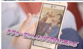
アレックス 見てて。 #チョーおいしいから勝手に売れる