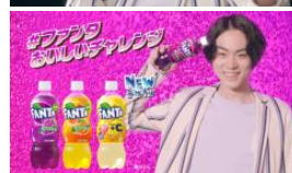
VO ファンタともっとおいしくなろう！