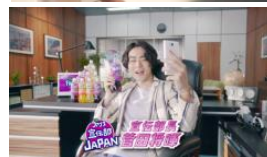
菅田さん OK！任せといて！ ファンタは超フルーティー、 シュワシュワだから