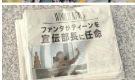
アレックス そうだよ！