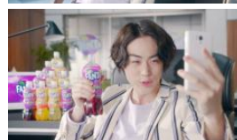
菅田さん だから勝手に売れるんだよ。