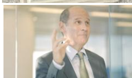
テッド キミが宣伝部長か？