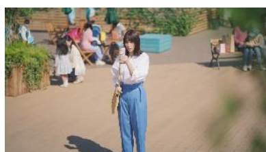
④ 【広瀬さん】 飲みやすかった