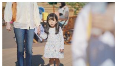
⑥ 【子役】 そんなに？