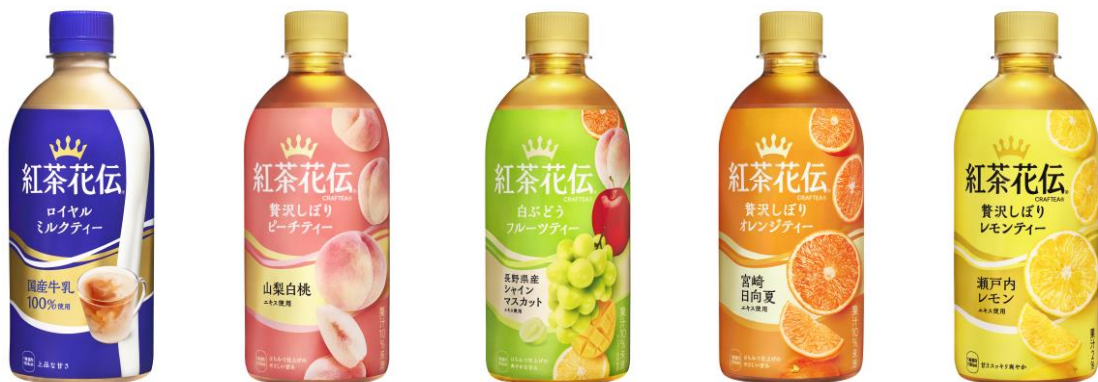
「紅茶花伝 ロイヤルミルクティー」

「紅茶花伝」のさらなるおいしさを直感的に伝えるべく、主力 5 製品のパッケージデザインを刷新します。素材そのもののおいしさを表現するダイナミックなレイアウトと、それぞれの味わいを表すビビットな色合いを強化することで、製品のおいしさと刷新感が感じられるパッケージへ生まれ変わります。