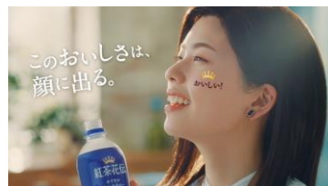
このおいしさは、 顔に出る。