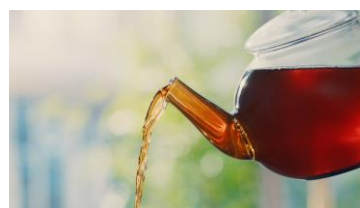
小芝さん OFF: 紅茶花伝は、 ティーポットで丁寧に淹れたような 味わいだから