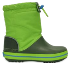
lime / forest green