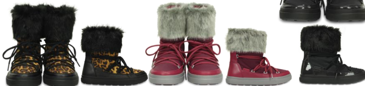
leopard / black (一部取扱い店のみ)