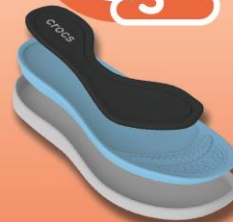
トリプルコンフォート

沈み込むような感覚を与える、クッションフットベッド。「クロスライト™」やPU素材のアウトソールと、クッション性の高いフットベッド、さらに低反発素材をのせました。履くたびに足にフィットする快適性を実感いただけます。