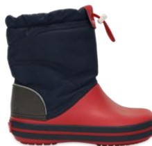
navy / red (一部取扱い店のみ)