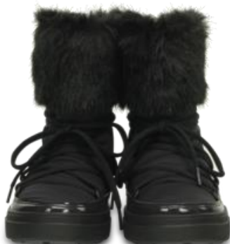
「ロッジポイントレースブーツ ウィメン」