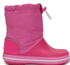
candy pink / party pink