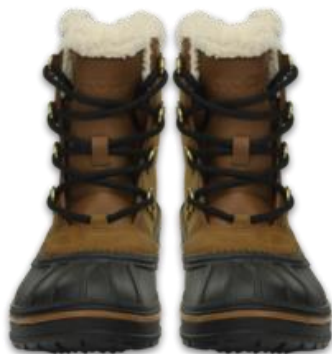
「オールキャスト 2.0 ブーツ」