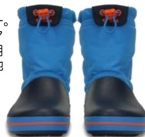
ocean / navy