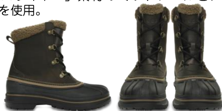
espresso / black