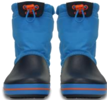
「クロックバンド TM ロッジポイントブーツ キッズ」

“Find Your Fun”をブランドテーマに、あらゆるライフスタイルに合った豊富なラインナップを展開するカジュアルフットウェアブランドのクロックス・ジャパン（東京都世田谷区、代表 永江 公一）は、軽やかな履き心地と暖かさ、そして高いファッション性を兼ね備えた、冬のおしゃれに欠かせない「ブーツ コレクション」を、メンズ、ウィメンズ、キッズにて展開。9月上旬（一部8月5日から発売開始）より全国のクロックス直営店、クロックスオンラインショップ、一部のクロックス取扱店にて順次発売を開始いたします。