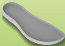
アイコニックコンフォート

クロックスの原点、「クロスライト™」素材。ヒールから地面へのふわりとしたクッション性は、今までの靴の概念を劇的に変えました。