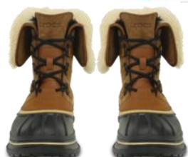
wheat / black

高級感のあるブーツ。本革スエードのアップパー、フェイクヌバックトリム。履き口は本物のシアリング、ブーツ内はフェイクシアリング。シームシールド加工を施したマチ付きの構造で、どんな天気でも履ける。防水性のあるTPRシェルを採用。「クロスライト™」素材のミッドソールとアウトソールの上にフットヘッドを使用。