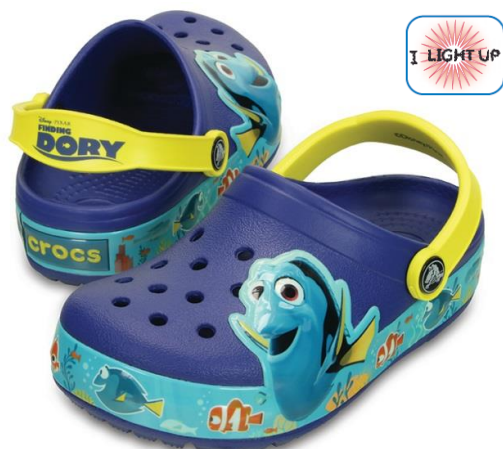
クロックスライト ファインディング・ドリー クロッグ キッズ