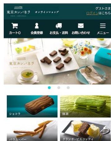
(左)PCサイト(右)スマホサイト