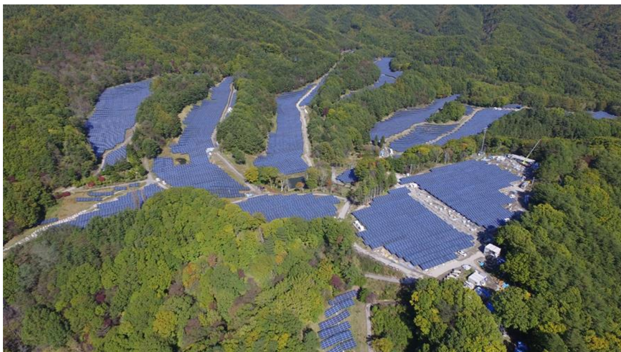
(駒ヶ根太陽光発電所 部分)