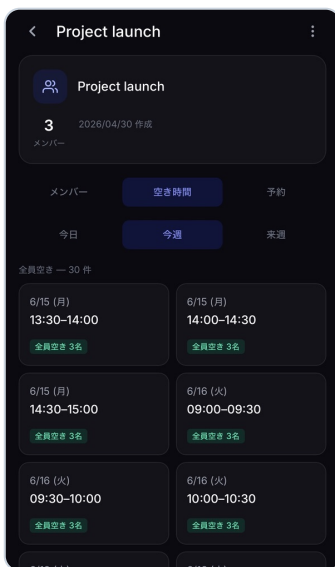
▲ Fig 1: Internal Workspace Availability Dashboard

Security is baked fundamentally into OneSlate. Even if workspace members belong to completely distinct email domains, individual calendar details (titles, descriptions, locations) remain strictly confidential and hidden from others. Only the availability blocks are referenced, saving administrators from the burden of creating and archiving temporary corporate accounts.