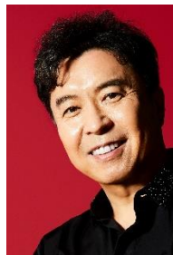
小曽根真 Makoto Ozone