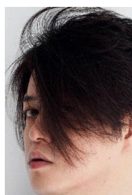
渋谷慶一郎 Keiichiro Shibuya