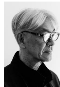
坂本龍一 Ryuichi Sakamoto