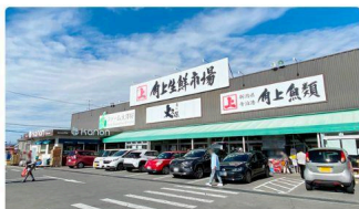
⑥ 角上魚類 諏訪店 (約2.2km)