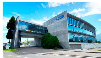
⑧ すわっこランド (約750m)