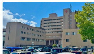
④ 諏訪赤十字病院 (約1.5km)