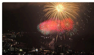
⑪ 諏訪湖祭湖上火火大会会場 (メイン会場約2.1km)