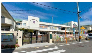
② すわせいほ幼稚園 (約2.0km)