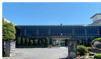
③ 城南小学校 (約2.0km)