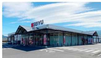
⑤ 西友諏訪城南店 (約1.8km)