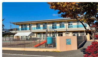
① ひなどり保育園 (約270m)