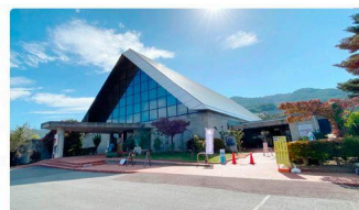
⑫ SUWAガラスの里 (約2.1km)

＜報道関係の方からのお問い合わせ先・プレスキット＞ cocoru諏訪 広報担当: 土田 MAIL / プレスキットはこちら