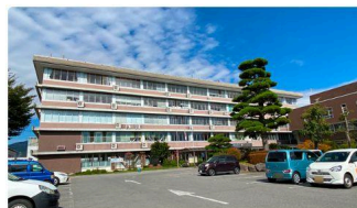
⑦ 諏訪市役所 (約2.0km)