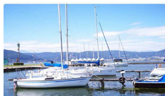
⑨ 諏訪湖ヨットハーバー (約950m)