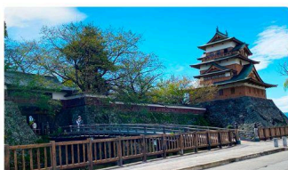
⑩ 高島城 (約1.8km)