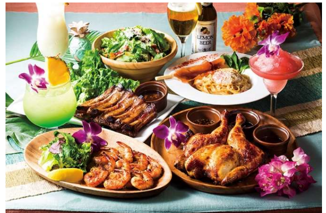
「ラ・オハナ」ハワイのロコフード

「ラ・オハナ」は、「ハワイの上質なリゾートホテルのレストラン」をコンセプトに掲げたブランドで、モーニング・ランチ・カフェ・ディナー、どのシーンも美味しいハワイ発のお食事とドリンクを楽しめる地域のコミュニティダイニングを目指しています。こだわりのハワイアンロコフードやトロピカルドリンクなどを取り揃えており、お客さまに大変ご好評をいただいております。