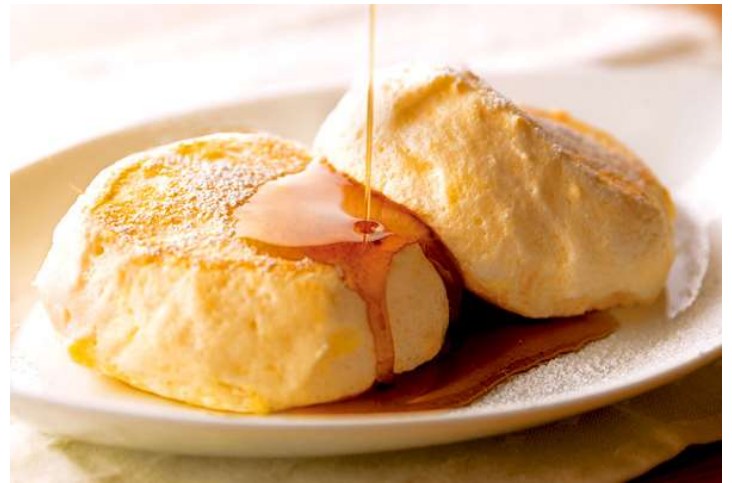
“むさしの森珈琲特製” ふわっとろパンケーキ

「むさしの森珈琲」は、「オールデイリビング」—ゆとりの癒し空間—をコンセプトに掲げたブランドで、朝・昼・夜を問わずゆっくりと好きな過ごし方ができる、地域のコミュニティカフェを目指しています。こだわりのドリンク・フードメニューを多彩に取り揃えており、お客さまに大変ご好評をいただいております。